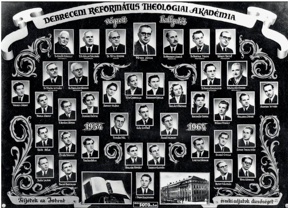
A Debreceni Református Theológiai Akadémia végzős hallgatóinak tablója 51

Intézményvezetői pozíciója mellett a Vallástörténeti Tanszéket is ő vezette. Ebben a másfél évtizedben ő volt az akadémia szemináriumi könyvtárainak felügyelő tanára, ő irányította a könyvtári állományok katalogizálását, és mindent megtett a külföldi teológiai szakirodalom beszerzéséért. 52