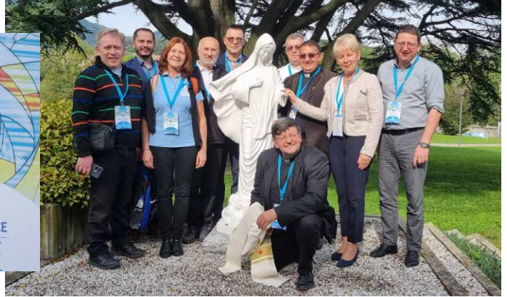
A négy magyar nyelvű rádió küldöttsége

Az idei konferencia különösen izgalmas volt, hiszen nemcsak a közösségi célkitűzések, de a média világában zajló legfrissebb technológiai újítások és missziós lehetőségek is fókuszba kerültek. A találkozó témái között szerepelt az egyház és a média közötti kapcsolat erősítése, az evangelizáció modern eszközei, valamint a hallgatósággal való kapcsolattartás új módszerei is. Az egyik legnagyobb hangsúlyt az új médiumok és platformok jelentette kihívások kapták, amelyek az evangelizáció hatékonyabbá tételét is elősegíthetik. Több előadás is kitért a mesterséges intelligencia alkalmazásának lehetőségeire, amelyek révén a rádiók célzottabban és személyre szabottan juttathatják el az üzenetüket az egyéni hallgatókhoz. A cél az, hogy a Mária Rádió minden generáció számára releváns és könnyen elérhető platform legyen. A konferencia során nemcsak szakmai előadások zajlottak, hanem lehetőség nyílt közös imára, szentmisére és lelki feltöltődésre is. Az eseményen megjelent püspökök és lelkipásztorok áldást adtak a jelenlévőkre, és buzdították őket az evangelizáció kitartó folytatására. Különösen megható pillanat volt a közös szentségimádás, amely