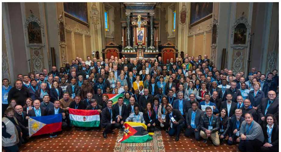
Pápai audiencián Rómában