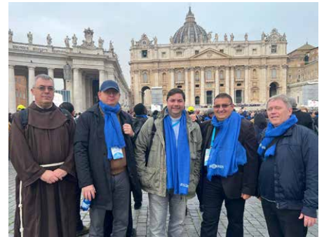
Pápai audiencián Rómában