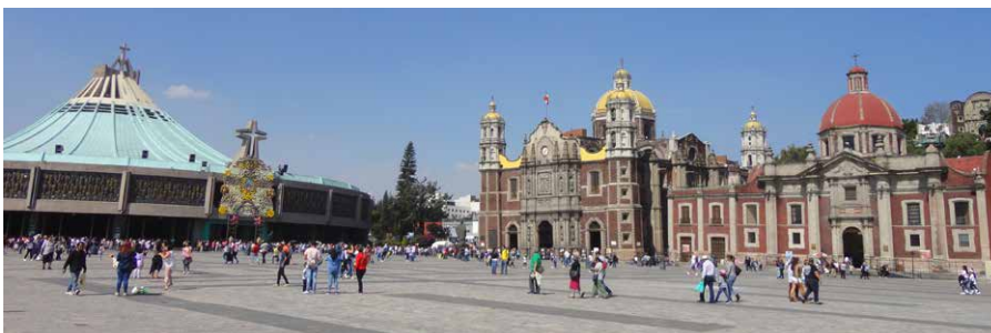
Libanoni Miasszonyunk templom