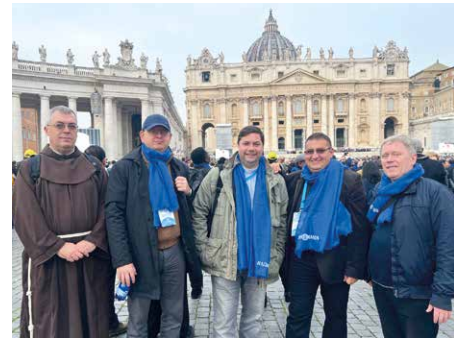
Pápai audiencián Rómában