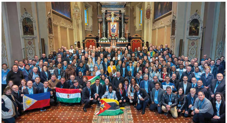
Mária Rádió Világsalád