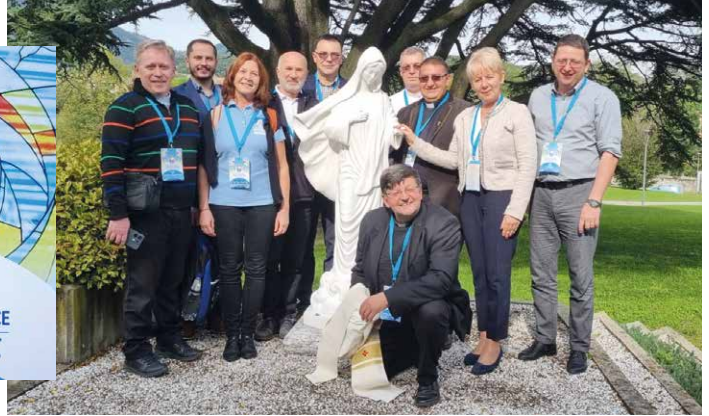
A négy magyar nyelvű rádió küldöttsége

Az idei konferencia különösen izgalmas volt, hiszen nemcsak a közösségi célkitűzések, de a média világában zajló legfrissebb technológiai újítások és missziós lehetőségek is fókuszba kerültek. A találkozó témái között szerepelt az egyház és a média közötti kapcsolat erősítése, az evangelizáció modern eszközei, valamint a hallgatósággal való kapcsolattartás új módszerei is. Az egyik legnagyobb hangsúlyt az új médiumok és platformok jelentette kihívások kapták, amelyek az evangelizáció hatékonyabbá tételét is elősegíthetik. Több előadás is kitért a mesterséges intelligencia alkalmazásának lehetőségeire, amelyek révén a rádiók célzottabban és személyre szabottan juttathatják el az üzenetüket az egyéni hallgatókhoz. A cél az, hogy a Mária Rádió minden generáció számára releváns és könnyen elérhető platform legyen. A konferencia során nemcsak szakmai előadások zajlottak, hanem lehetőség nyílt közös imára, szentmisére és lelki feltöltődésre is. Az eseményen megjelent püspökök és lelkipásztorok áldást adtak a jelenlévőkre, és buzdították őket az evangelizáció kitartó folytatására. Különösen megható pillanat volt a közös szentségimádás, amely