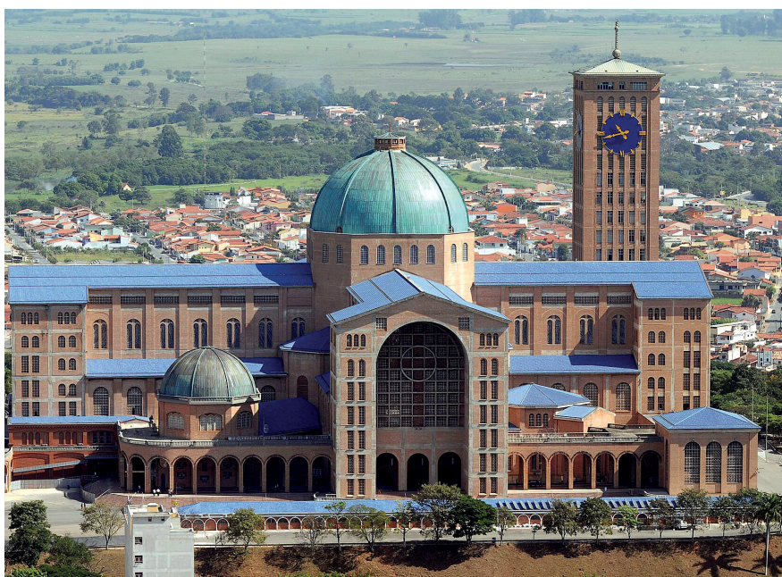
Aparecida-Miasszonyunk Bazilika