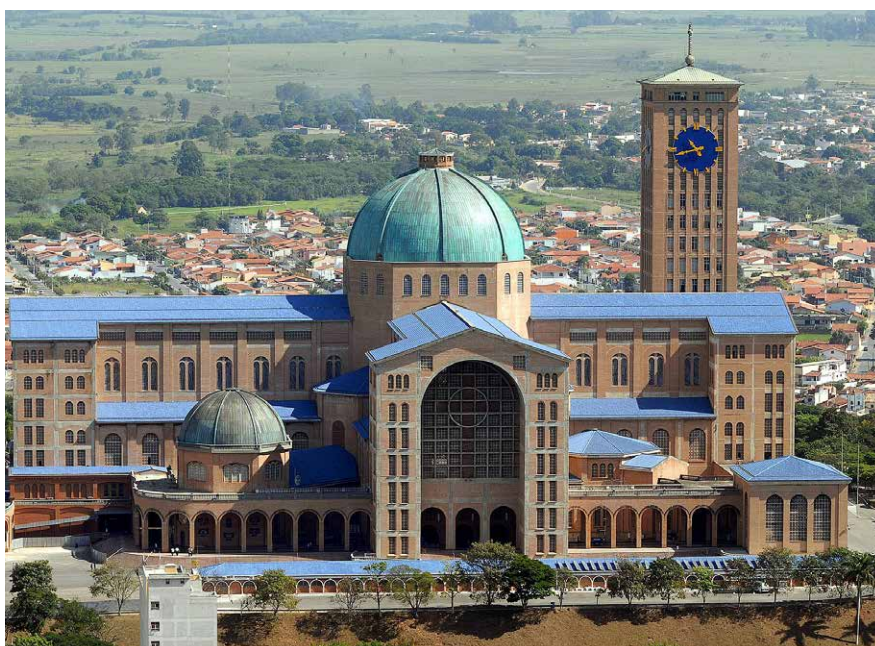
Aparecida-Miasszonyunk Bazilika