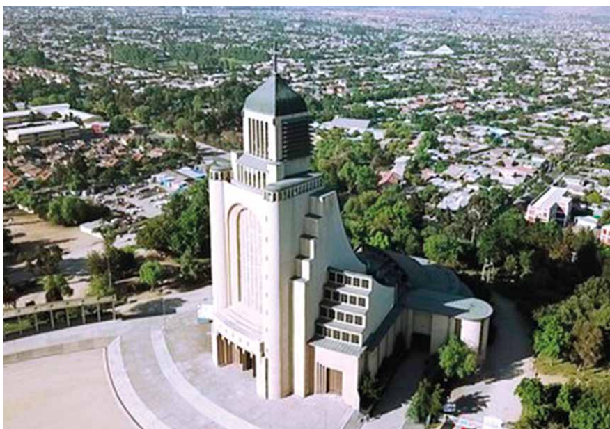
Kármel-hegyi Boldogasszony templom-Maipú