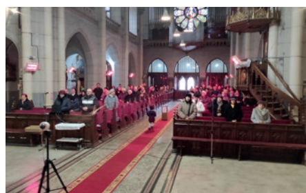
Temesvár - Erzsébetváros