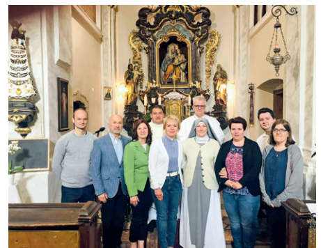
A felvidéki Mária Rádió születésnapján