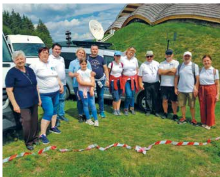
A Csíksomlyói búcsún

Nagyon hálás vagyok a mindenható Istennek és a Szűzanyának, hogy a stúdió létre jöhetett. Igaz olyan kicsi volt, hogy ketten alig fértek el benne, de volt. 2022-ben egy újabb lehetőséget kaptunk, amikor egy nagyobb épületbe költözött a stúdió, ami szintén a helyi támogatásából jött létre. Ez úton is megköszönöm mindenkinek hozzáállását, imáját és anyagi támogatását. Megtapasztaltuk a mennyei segítséget és kegyelmet.