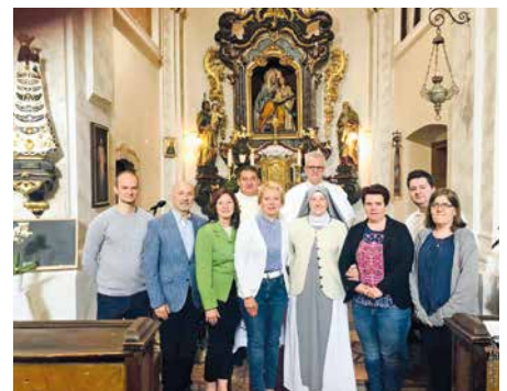
A felvidéki Mária Rádió születésnapján