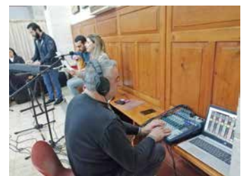
Názáret (Izrael), Don Guanella-Szent Család központ, Jó pásztor kápolna 2022. márciusi közvetítés helyszíne