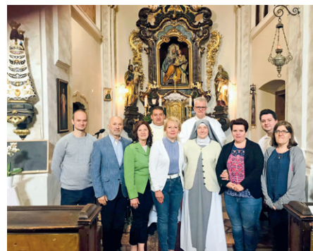
A felvidéki Mária Rádió születésnapján