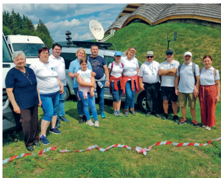
A Csiksomlyói búcsún

Nagyon hálás vagyok a mindenható Istennek és a Szűzanyának, hogy a stúdió létre jöhetett. Igaz olyan kicsi volt, hogy ketten alig fértek el benne, de volt. 2022-ben egy újabb lehetőséget kaptunk, amikor egy nagyobb épületbe költözött a stúdió, ami szintén a helyi támogatásából jött létre. Ez úton is megköszönöm mindenkinek hozzáállását, imáját és anyagi támogatását. Megtapasztaltuk a mennyei segítséget és kegyelmet.