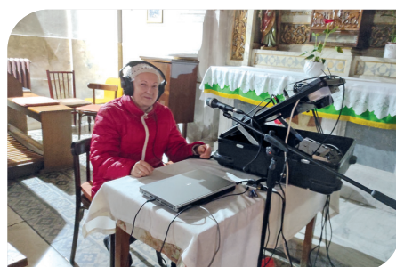
Szentmise közvetítés Temesvárról