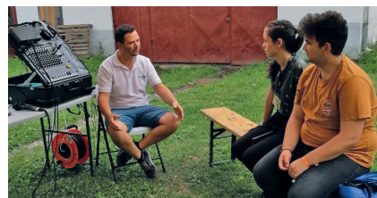
Műhelymunka a CSIT-en