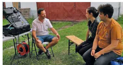
Műhelymunka a CSIT-en