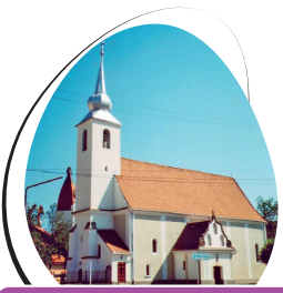
» CSÍKSZEREDA-SZENT KERESZT