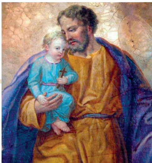
Összeállította: Dallos Ágnes

A szentatya szeretne emléket állítani Mária jegyesének, Jézus nevelőapjának, akit a katolikus egyház védőszentjeként tisztelünk immár 150 éve.